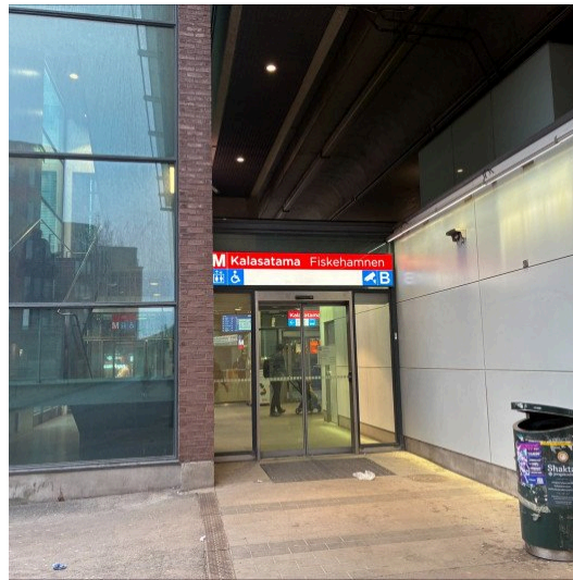
Kalasadaman metroaseman Lautatarhankadun puoleinen B-sisäänkäynti.

Lue lisää liikennemuutoksista Kaupunkiliikenteen sivuilla →